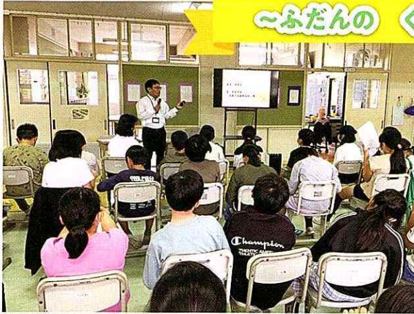
▲高齢者についての講義