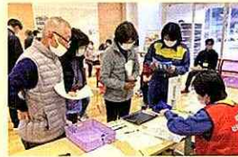
◀災害ボランティアセンター設置・運営訓練