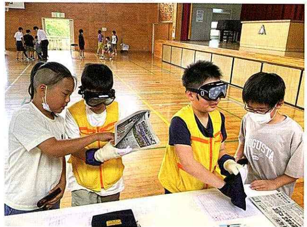
▲装具を使用して高齢者疑似体験

5月27日(月)に御嵩小学校5年生を対象に福祉体験教室(車いす体験と高齢者疑似体験)を実施しました。