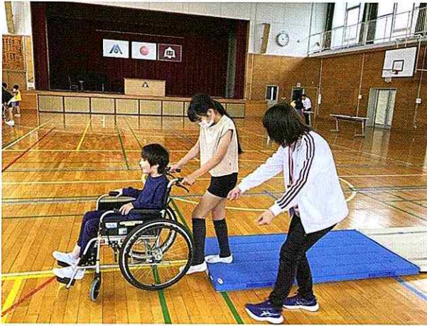
▲マットを利用して車いすでの悪路走行の体験