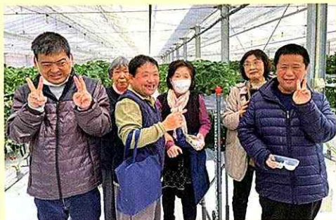
▲ 希らりウォークの実施