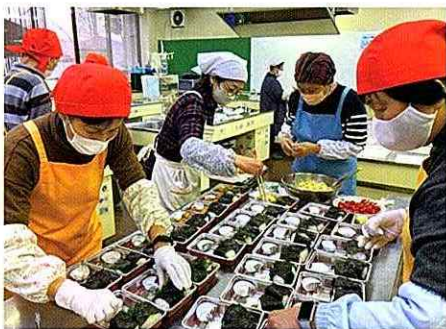
支部社協活動の支援 (中支部こどもお弁当食堂)