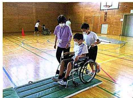
町内の小学校への福祉学習指導