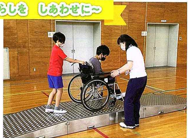
▲スロープでの上り下りの体験